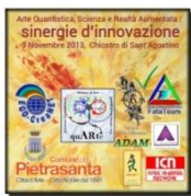
Conferenza Exhibition by quARTE

Omaggio di Fabio Di Donato a Margherita Hack in uno splendido videomontaggio sulle note della Suite per Orchestra Jazz n. 2 di Dmitrij Shostakovich, assemblando 20.00 immagini di Saturno riprese dalla sonda Cassini-Huygens in nove anni di attività [non consigliato per i sofferenti di epilessia]